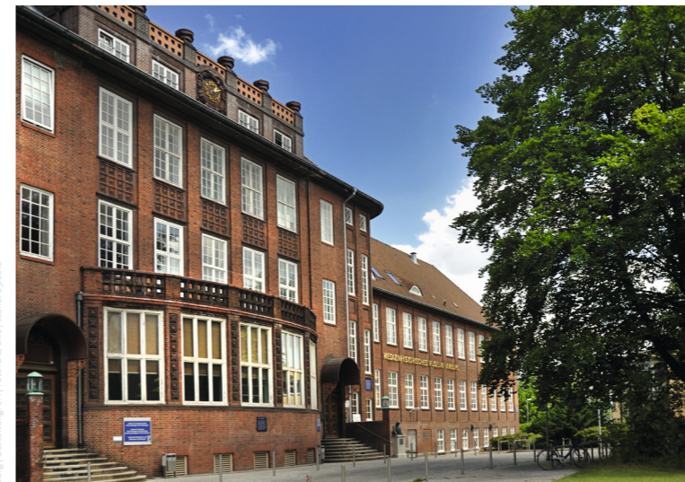
Impressum: Universitätsklinikum Hamburg-Eppendorf (UKE), Institut für Geschichte und Ethik der Medizin, Martinistraße 52, 20246 Hamburg; Gestaltung: SHH Stand 01.2018