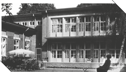
Die Gebäude verschwanden in den 1980ern