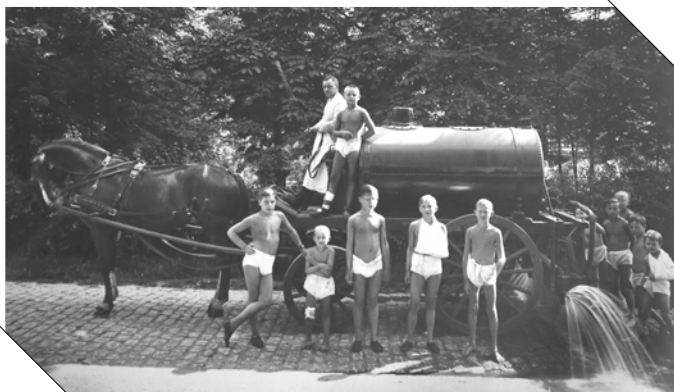
Ein Sprengwagen, der die Pflanzen und Bäume auf dem Gelände wässerte, bot den jungen Patienten bei Hitze willkommene Abwechslung