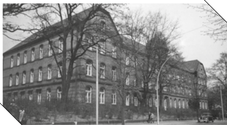
1901 nahm die Augenklinik ihre Arbeit auf