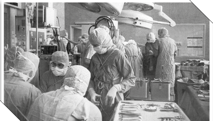
Die chirurgischen Methoden wandelten sich im Lauf der Zeit gewaltig. Hier der große OP-Saal der Chirurgischen Klinik aus den 1980er Jahren