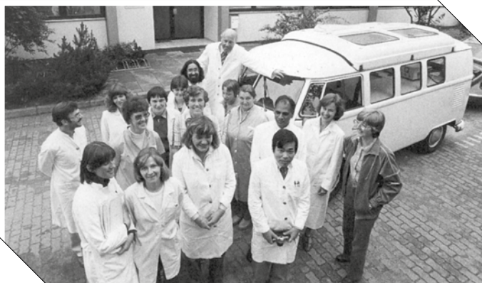
Die Mitarbeiter des Instituts für Humangenetik waren nicht nur im Labor aktiv, sondern unternahmen auch Expeditionsfahrten