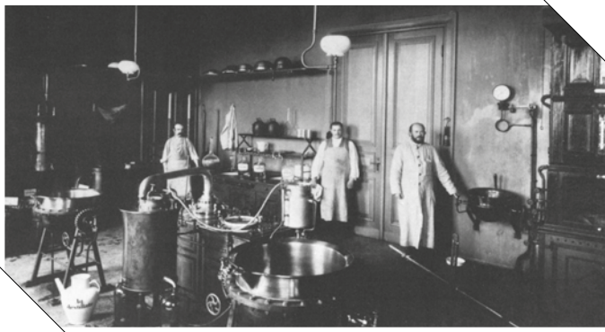
Im Laboratorium der Apotheke wurden bereits 1890 Arzneien hergestellt. Heute ist die UKE-Apotheke akademische Ausbildungsapotheke

Das UKE hat viele Gesichter und sie haben sich im Laufe der Jahre auch vielfach verändert. Einiges verschwand, einiges blieb erhalten und wird heute noch genutzt. Eine Entdeckungsreise.