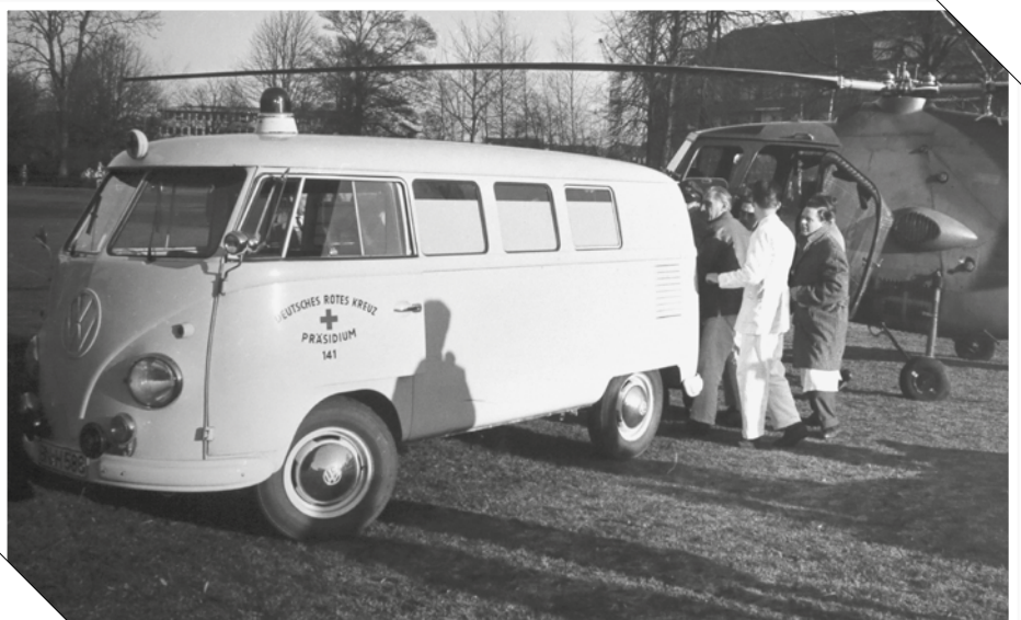
1962 landete der Rettungshubschrauber im Park vor dem UKE – heute auf dem Klinikdach