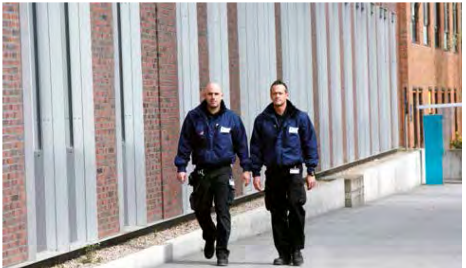
Rund um die Uhr sind Mitarbeiter des Sicherheitsdienstes „auf Streife“. Beim Tag der offenen Tür stehen sie vor besonderen Herausforderungen, werden doch rund 20 000 Besucher erwartet