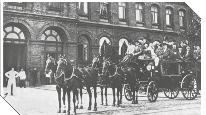
Mitarbeiterausflüge sind, wie dieses Foto kurz nach Eröffnung des Neuen Allgemeinen Krankenhauses zeigt, keine Erfindung der Neuzeit