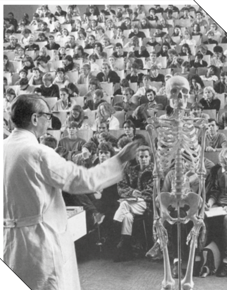
Diese Vorlesung thematisiert das Skelett