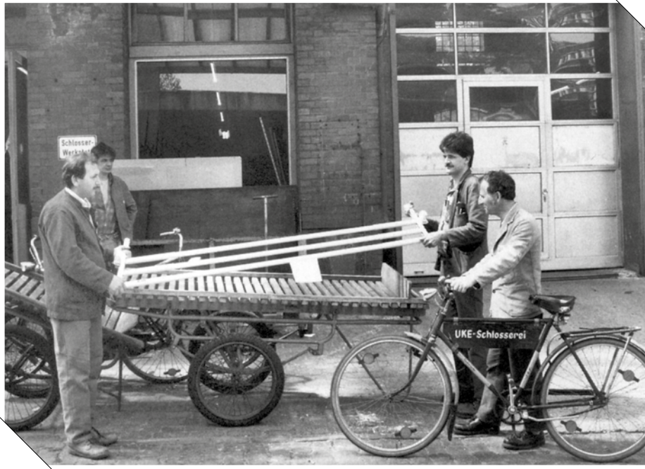
In diesem Gebäude war bis zum Bau des Neuen Klinikums die Schlosserei des UKE untergebracht. Bei gutem Wetter radelten die Schlosser zu ihren vielfältigen Einsatzorten