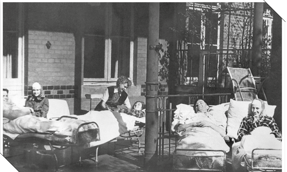
Statt im Pavillon 61 zu liegen, genossen diese Kranken um 1955 auf der Terrasse die frische Luft