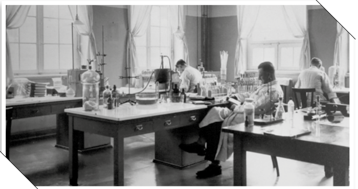
Diese Herren forschten um 1930 im neuen Bakteriologischen Laboratorium des Instituts für Serologie und experimentelle Therapie