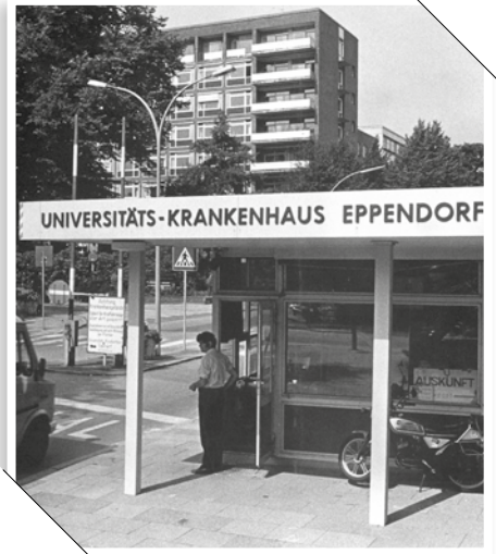
Der alte Haupteingang des UKE verschwand mit der Eröffnung des Neuen Klinikums